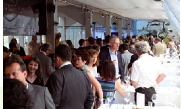
Eintreffen am Badeschiff

Am 30. Juni feierte ARGO 15 jähriges Bestehen am Badeschiff nahe der Urania. Trotz stürmischen Wetters war die Stimmung bestens, eine kommentierte Fotoreise in die Vergangenheit der ARGO rief Heiterkeit und Erinnerungen gleichermaßen wach. Zum „Nach-Erleben“ und „Sich-Wiederfinden“ auf unserer neuen Webpage www.argo.at !