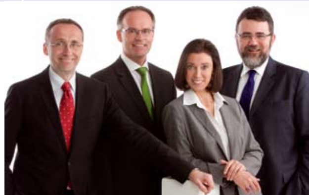
... bis 2011 geschäftsführende Gesellschafter