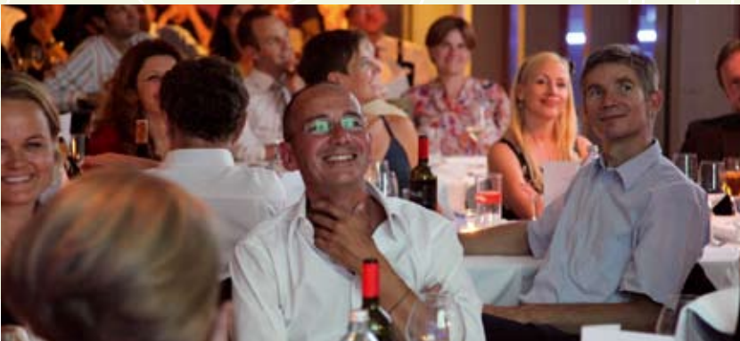
Ja, aber Spaß muss sein!